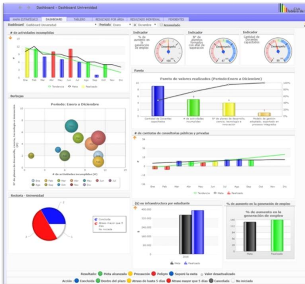
Imagen del Dashboard del Software 100% Web

Dashboard: Un panel con gráficos informa el estado de avance de los KPI de cada uno de los responsables.